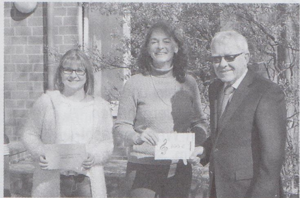
Übergabe an Sozialstation“