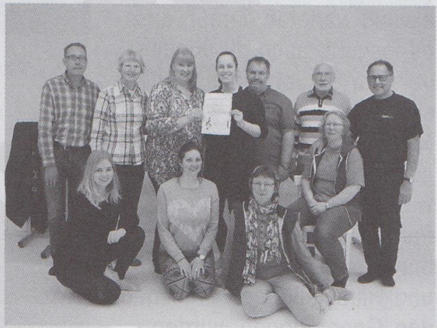
Übergabe an projekt:tanz e.V.